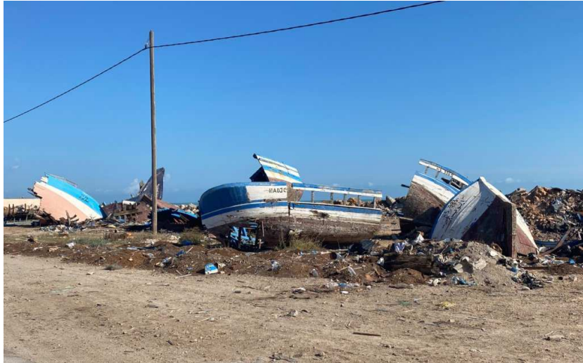
Des bateaux de pêche détruits au port de Zarzis.