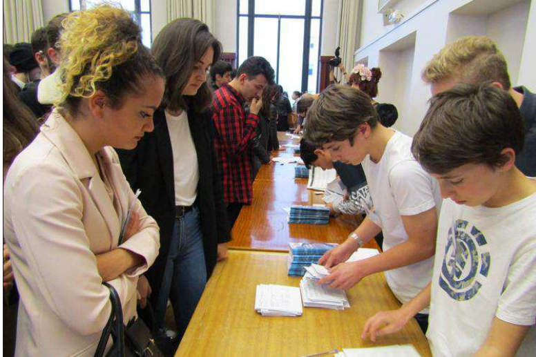
■ La carte d'électeur, symbole de la vie citoyenne.

Plus de 300 jeunes majeurs ont reçu, mercredi, leur première carte d'électeur, lors d'une cérémonie citoyenne à l'hôtel de ville. Pour cette promotion de nouveaux électeurs, il fallait une figure. C'est celle de Catherine Switzer, première femme marathonnienne, qui a été choisie par les jeunes de Villeurbanne. Femme d'exception, cette dernière s'était inscrite à la course de Boston en 1967, en ne citant que l'initiale de son prénom. Mis devant le fait accompli, les organisateurs n'avaient pu l'empêcher de concourir. Un beau symbole pour les jeunes Villeurbannais.