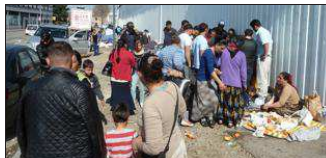
■ Mercredi, rue Decorps.

Decorps aurait exigé que des familles qui n'occupaient pas ce lieu soient également hébergées, faute de quoi personne ne resterait. Une position inacceptable pour Xavier Inglebert, préfet délégué à l'Égalité des chances qui, s'appuyant sur un diagnostic social de l'Action pour l'insertion par le logement, sait qui vivait sur place. « La règle est que, quand on a refusé un abri, on n'y a plus le droit », soulignait le représentant de l'État. Et cela avant de laisser une dernière chance aux squatters albanais de s'insérer dans le dispositif