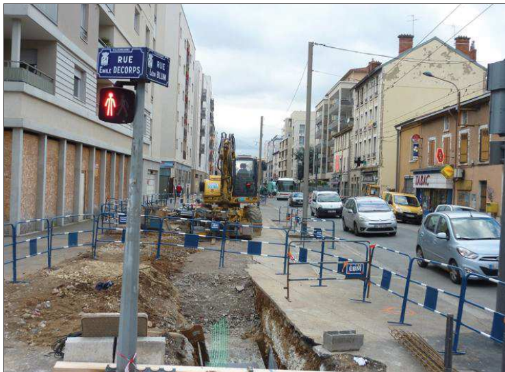
■ Les automobilistes vont devoir prendre leur mal en patience.

Les travaux liés à l'aménagement du double site propre de la ligne de trolleybus C3 avancent. Avec leurs lots de difficultés : bruit, poussière et circulation entravée.