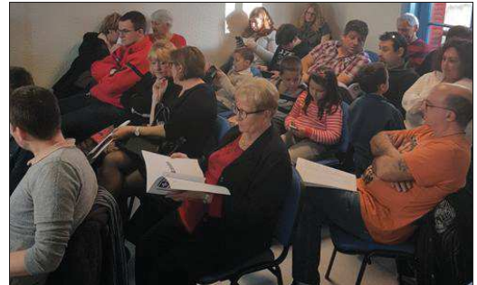
■ La Croix Blanche de Villeurbanne est très présente lors des manifestations sportives et festives.

Samedi après-midi, la section villeurbannaise des sauveteurs français de la Croix Blanche organisait son assemblée générale.