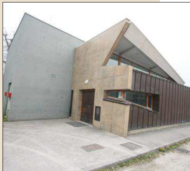
■ La salle des fêtes familiales a accueilli des SDF, dans le cadre du plan Grand froid déployé sur la Métropole de Lyon.

Depuis le 19 janvier, dans le cadre du dispositif Grand froid et à la demande de la préfecture du Rhône, la mairie de Villeurbanne mettait à disposition la maison des fêtes familiales, avenue Marcel-Cerdan près de l'Astroballe, pour l'hébergement d'urgence des SDF pour les nuits glacées de la mi-janvier. Trente places étaient ouvertes pour au moins dix jours théoriques. Elles étaient gérées par le 115 et sur place, par l'association Entraide Pierre-Valdo. Dans la semaine, le dispositif doit prendre fin, a annoncé la préfecture. La salle va donc fermer ses portes. Ces dernières nuits, elle accueillait déjà moins de SDF qu'au début de sa mise en fonction.