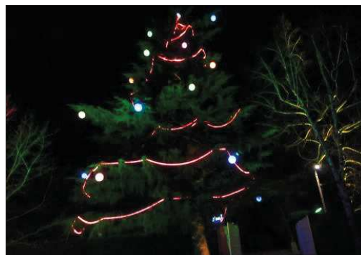
■ Le sapin de plus de 20 mètres de haut est décoré avec une vingtaine de boules multicolores de grand diamètre.

PRACTIQUE Illuminations visibles chaque soir dès la tombée de la nuit, jusqu'au 23 janvier, chemin des Noyeraies, quartier du Barriot, Dardilly-le-Haut.