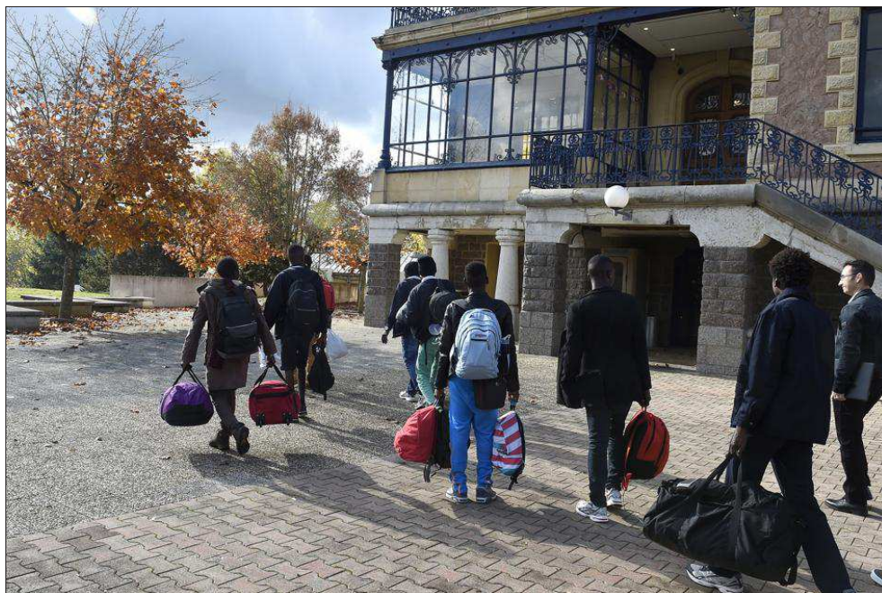
■ Les migrants arrivent dans la structure d'accueil de Saint-Denis-de-Cabanne avant de prendre possession de leur hébergement.

Soixante-six migrants se sont installés place au centre de vacances de la Durie à Saint-Denis-de-Cabanne, ce lundi. Ils resteront entre trois et cinq mois, le temps d'étudier leurs situations respectives.