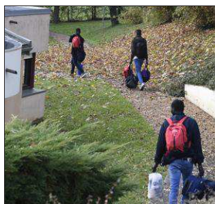
■ Les migrants disposeront des grands espaces qu'offre le centre de la Durie, et de ses équipements sportifs.

Passés par les Landes après avoir quitté la « jungle de Calais » le mois