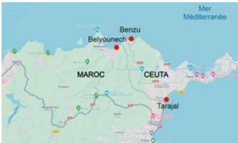
Figure 3 L'enclave espagnole de Ceuta est frontalière du Maroc.

Ces récentes arrivées contrastent avec la situation observée l'année dernière. En 2023, le centre de séjour temporaire pour immigrés (CETI) de Ceuta a accueilli au total 1 093 personnes, soit le chiffre le plus bas depuis 2010, hors pandémie. Cette année-là, 977 migrants avaient été comptabilisés. Le centre dispose d'une capacité maximale de 512 places. Il accueille actuellement 250 migrants subsahariens, algériens et marocains. La semaine dernière, le conseiller à la Présidence du Gouvernement de l'enclave a tout de même demandé " d'accélérer les mécanismes de répartition des mineurs qui entrent dans la ville ". Celle-ci " disposant de ressources limitées qui débordent rapidement et la rendent incapable de faire face à des situations d'afflux massifs ". Le gouvernement prévoit d'investir 5,6 millions d'euros dans le CETI - dont les derniers travaux datent de 2004 - pour refaire à neuf les huit blocs d'hébergement et construire une annexe pour les " situations d'urgence ". Ce bâtiment remplacera les casernes militaires utilisées en cas d'afflux de personnes, comme ce fut le cas en 2017 et 2018.