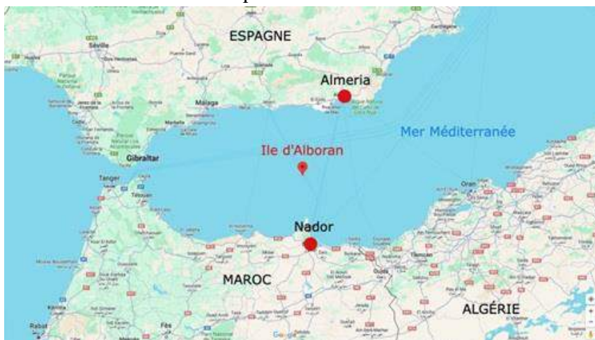
Figure 2 L'île espagnole d'alboran se trouve en face d'Almeria et de Nador.

Le week-end dernier, samedi 24 et dimanche 25 février 2024, près de 200 personnes ont débarqué sur cet îlot espagnol inhabité au large d'Almeria, où est installée une unité de la Marine. Rapidement après les arrivées d'exilés en petits bateaux à moteur, plusieurs transferts ont été opérés en hélicoptères. Dimanche après-midi, les secours ont emmené une femme et quatre mineurs vers l'hôpital universitaire de Torrecárdenas, à Almeria. Quelques heures plus tôt, dans la matinée, un homme qui présentait de forts symptômes d'hypothermie a également été évacué. À son arrivée sur la péninsule ibérique, l'homme était " conscient et stabilisé ". Il a ensuite été transféré en ambulance à l'hôpital. Il est mort vendredi 1er mars, à l'hôpital universitaire Torrecárdenas d'Almeria. Aucune information n'a été fournie quant à son identité.