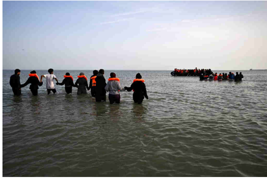
Des migrants se dirigent vers un canot dans la Manche pour tenter de rejoindre la Grande-Bretagne, depuis la plage de Petit-Fort-Philippe à Gravelines, près de Calais, en France, le 23 mai 2026.

Au moins six navires des forces françaises ont assuré la surveillance de ces "small boats". "Compte tenu de la fragilité structurelle des embarcations systématiquement surchargées, le choix est fait de ne pas contraindre les migrants à embarquer sur les moyens de sauvetage de l'État, pour éviter de mettre en péril leur vie en cas de naufrage", explique la prémar.