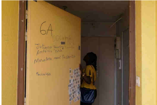
Inès, occupante du squat du 25 place de Milan.