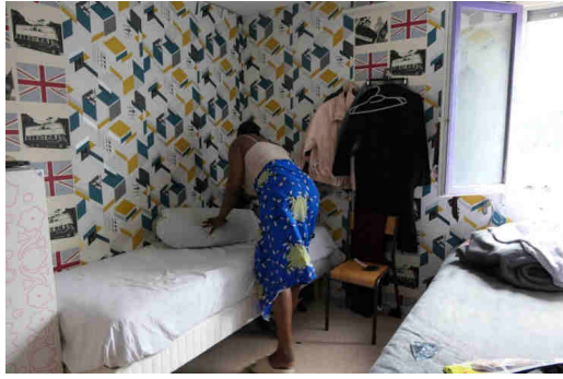
Une habitante du bâtiment occupé place de Milan, à la Part-Dieu (Lyon).