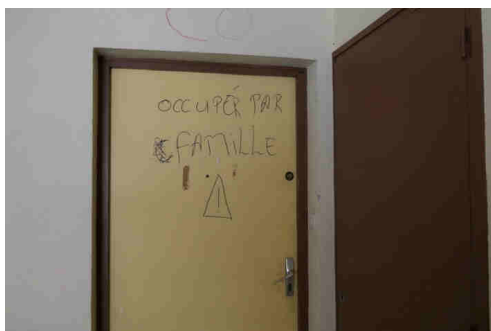
Les occupants ont investi les lieux en mars 2026.