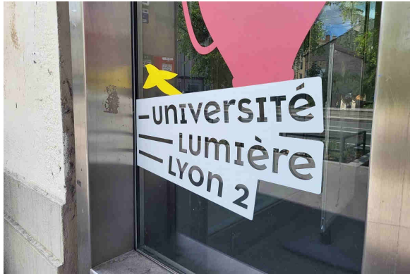
A l'entrée de l'université Lyon-2, sur le campus des Berges du Rhône.