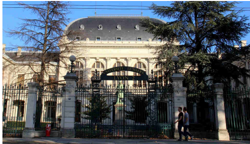
L'université Lyon 2, campus « Berges du Rhône ».

En avril dernier, une première CFVU a rejeté le plan de répartition proposé. Une victoire pour les opposants à la politique d'austérité. Une seconde session exceptionnelle était donc convoquée ce mardi 12 mai. Cette fois, la répartition a été adoptée, sur la base d'une deuxième version à peine moins sévère. « On a obtenu 1000 heures de plus. A l'échelle d'une faculté ça représente quelques TD en plus. Autant dire pas grand-chose », explique Mickael Lallouche, enseignant à la faculté d'économie et gestion.