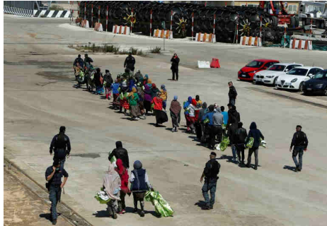
Des migrants arrivent en Italie.