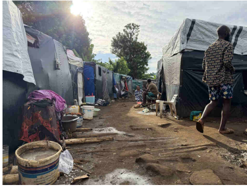
Dans le campement de Tsoundzou 2, à Mayotte.