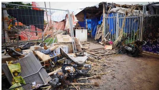
L'entrée du camp de Tsoundzou, à Mayotte, le 7 avril 2026.

Au travers des allées, les bruits de marteaux sur le bambou rythment la vie du camp. Ici, on construit ses propres maisons, on ne compte plus vraiment sur l'État pour trouver une solution. "Appeler le 115 pour sortir d'ici ? Vous plaisantez, personne ne répond jamais", confie une Congolaise en riant.