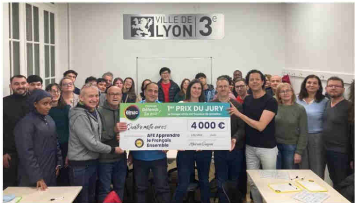
L'Association AFE a été récompensée par le groupe EM2C.