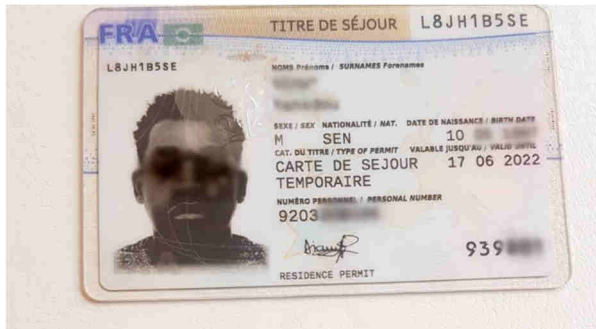
Un titre de séjour français temporaire (image d'archive).

Sans régularisation en bonne et due forme, tout une vie peut s'effondrer. Impossible, par exemple, de souscrire à l'assurance maladie, car il faut prouver régulièrement qu'on est en situation régulière. De plus en plus aussi, les banques demandent aux ressortissants étrangers de démontrer qu'ils sont bien en situation régulière. En cas de problèmes, vous risquez de ne pas avoir de compte en banque.