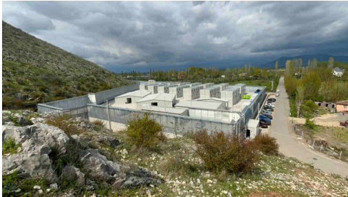
Le centre de Gjader, en Albanie, en avril 2025.

L'Italie détient également dans le centre des personnes qui s'étaient intégrées dans le pays, mais qui ont perdu leur emploi et, par conséquent, leur permis de séjour, précise l'ONG.