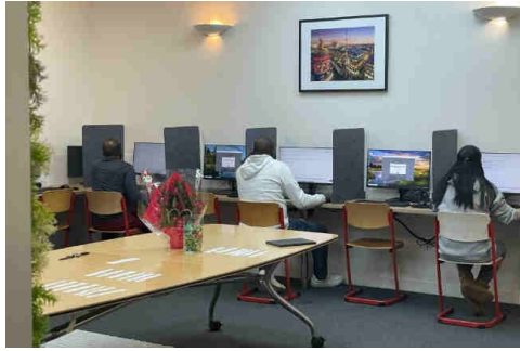
Trois candidats en plein examen civique, samedi 14 février 2026.

Ce samedi matin, ils sont huit candidats, à bûcher, les mains sur le clavier. Finies les feuilles papiers, le test se passe sur support numérique. Une fine cloison feutrée sépare les ordinateurs. Pendant 45 minutes, les postulants devront répondre à 40 questions à choix multiples (QCM) portant sur leurs connaissances de l'histoire de France, des valeurs républicaines, de la géographie française... Des "mises en situation" sont aussi proposées. Pour réussir l'examen, un taux de bonnes réponses de 80 % est exigé (soit un score minimum à atteindre de 32/40). Les résultats arrivent en 48 heures.