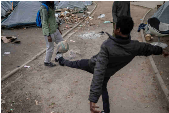
Le football est important pour tenir le coup.

Tétanisés, certains ne sortent même plus du campement. « J'ai peur de la ville, soupire l'un d'eux. Tout seul, je ne connais pas. » Ils craignent aussi des contrôles dans les transports en commun. Un problème soulevé depuis longtemps par le collectif Soutiens/Migrants Croix-Rousse. Pour aller au secours populaire, aux distributions de repas, effectuer les démarches juridiques... il faut se rendre aux quatre coins de la ville. Sans papier, ni moyen de payer un titre de transport, ils reçoivent régulièrement des amendes. Du stress qui s'ajoute à la détresse.