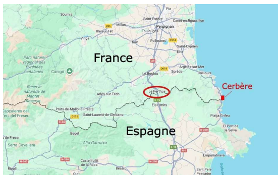
La frontière franco-espagnole, dans les Pyrénées-orientales.

Selon nos confrères de France Bleu , le préfet, Pierre Regnault de la Mothe, en déplacement dans les locaux de la police aux frontières (PAF) au Perthus sur l'autoroute A9, a évoqué "une pression migratoire qui s'accroît et une efficacité renforcée de nos services". Durant cette visite, le préfet a mis l'accent sur une "coopération quotidienne et exemplaire" avec l'Espagne qui a conduit à 436 missions mixtes dans tous les trains transfrontaliers du département.