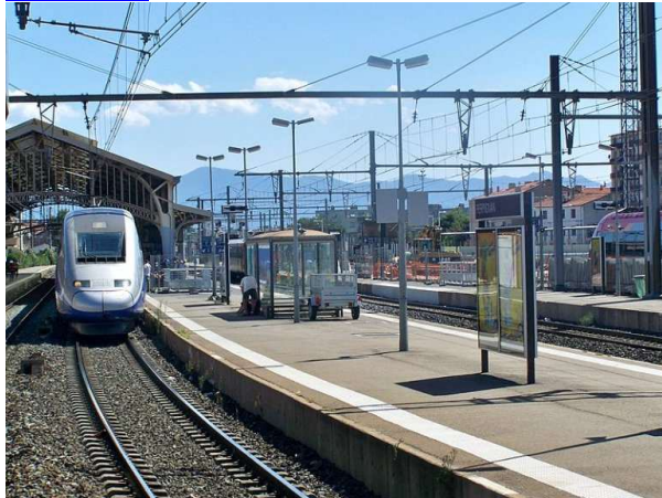
La gare de Perpignan, dans les Pyrénées-Orientales.