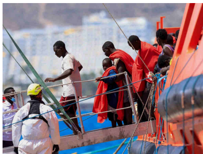
Des migrants arrivent à Grande Canarie, le 24 août 2025.

L'Espagne est l'un des trois principaux points d'entrée pour les migrants en Europe, avec l'Italie et la Grèce. Les îles Canaries, situées dans l'Atlantique au large de la côte nord-ouest de l'Afrique, constituent une porte d'entrée importante pour la migration irrégulière vers l'Espagne, avec des records d'arrivées enregistrés l'an dernier où 47 000 personnes ont été recensées, du jamais vu.