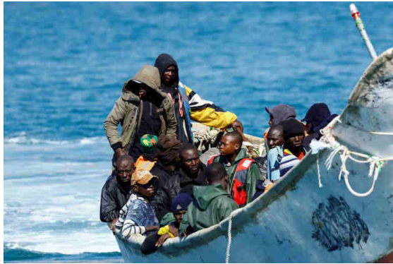
Une embarcation de migrants au large de Grande Canarie, le 29 janvier 2025.