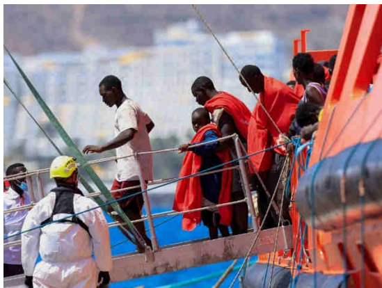
Des migrants arrivent à Grande Canarie, le 24 août 2025.

Dans ce contexte, le président des Canaries a envoyé une lettre à la Cour suprême mardi 23 septembre pour se plaindre de la lenteur des transferts de mineurs isolés. Il estime que Madrid commet un "outrage" et une "désobéissance manifeste" sur le sujet.