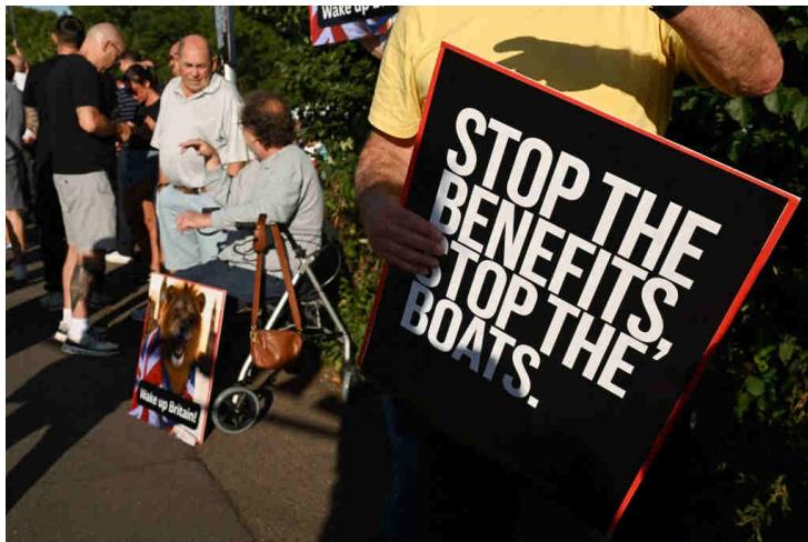
Un manifestant contre l'hôtel d'Epping (au nord de Londres), qui héberge des demandeurs d'asile, le 8 août 2025.

Malgré l'augmentation du nombre de demandeurs d'asile, le traitement de leurs dossiers est devenu plus expéditif. En effet, le nombre de personnes en attente d'une décision initiale est en baisse. Elles sont 90 812 selon le Home Office, soit une importante baisse de 24% par rapport à l'an dernier.