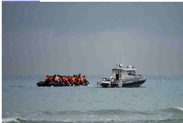
Des migrants dans la Manche, le 4 septembre 2024.