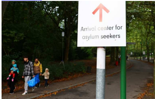
Photo : Un centre d'accueil pour demandeurs d'asile dans le quartier de Reinickendorf à Berlin, en Allemagne, le 6 octobre 2023