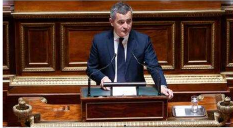
Gérald Darmanin parviendra-t-il à trouver une majorité pour voter sa loi immigration, sans 49-3 ?

Ces dix-sept députés, emmenés par Jean-Louis Thiériot, se disent prêts à voter le texte pour autant qu'il reste proche de la version, durcie, adoptée par le Sénat, à majorité de