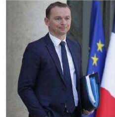
Olivier Dussopt est jugé ce lundi pour des soupçons de favoritisme.

Après Éric Dupond-Moretti, un autre ministre en exercice, Olivier Dussopt, est appelé à s'expliquer devant la justice à partir de ce lundi, pour des soupçons de favoritisme liés à un marché public passé en 2009, alors qu'il n'était pas encore au gouvernement, et qu'il conteste.