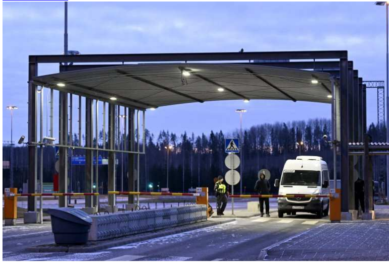
Poste-frontière de Nuijamaa en Finlande, le 16 novembre 2023.