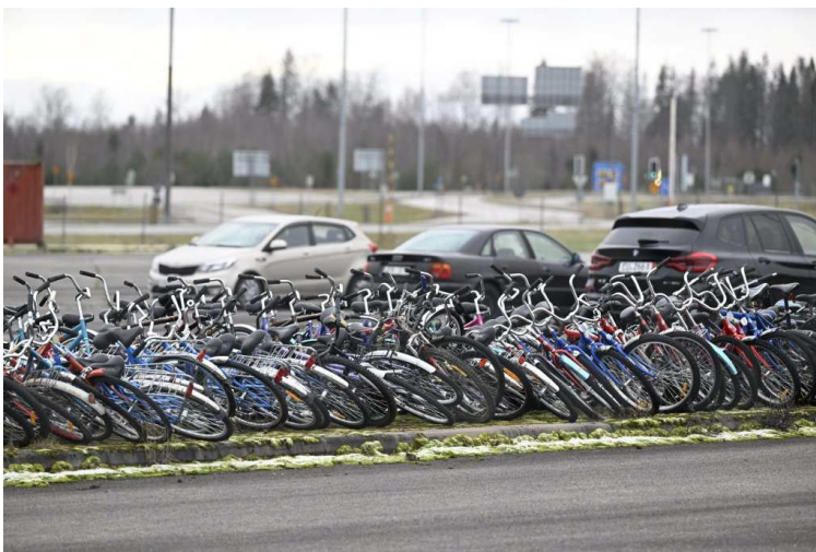
Des dizaines de vélos saisis au poste-frontière finlandais de Nuijamaa, le 15 novembre 2023.

Beaucoup de tentatives de passage se sont faits par... vélo. Sur l'agence de presse Reuters, des rangées de vélos ont été pris en photo à différents postes-frontières, notamment à Nuijamaa. L'explication ? Traverser les poste-frontières finlandais à pied est interdit. Helsinki a, depuis toujours, facilité le passage de ses frontières à deux roues, grâce à un accord entre les commissaires aux frontières, explique SchengenVisaInfo.com. Ces traversées à vélo permettaient aux habitants de la région frontalière d'entreprendre de courtes excursions d'une journée vers le pays voisin.