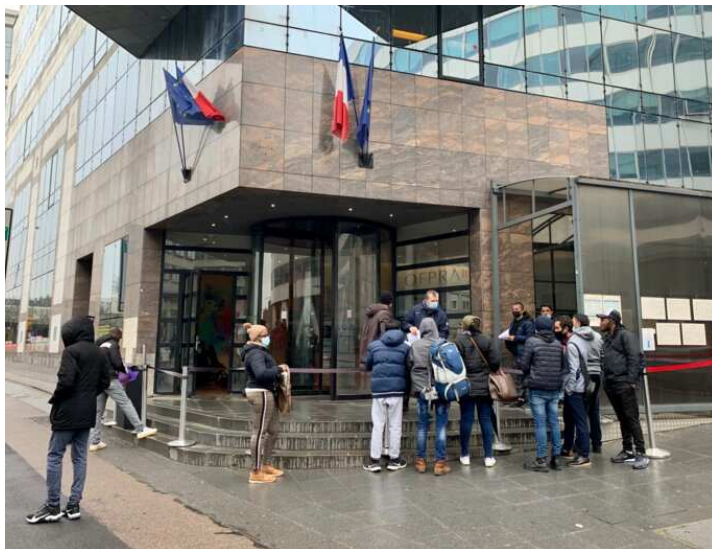
Des demandeurs d'asile devant l'Office français de protection des réfugiés et apatrides (Ofpra), le 5 avril 2022.

Parmi elles, les procédures dites accélérées, les décisions rendues par ordonnance à la CNDA ou le recours au juge unique à la CNDA, qui permettent d'« expédier » certains dossiers jugés trop faibles ou peu convaincants.