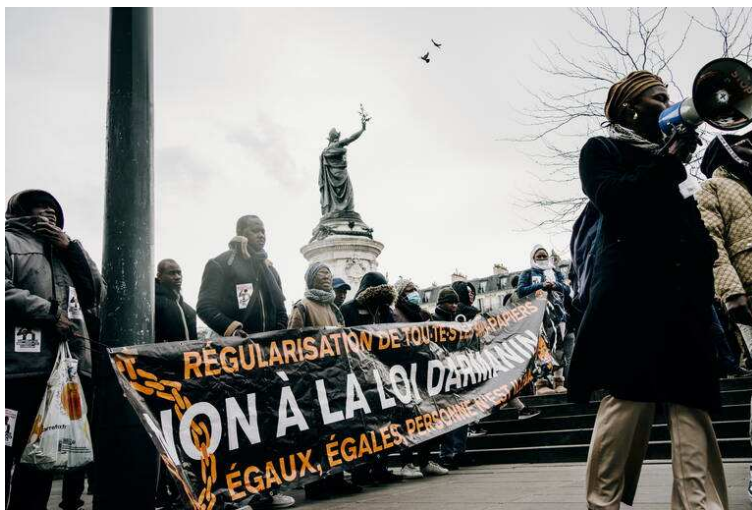
Marche antiraciste, le 18 mars 2023 à Paris.

Selon un sondage Viavoice pour «Libération», une majorité de Français sont favorables au texte de Gérard Darmanin débattu à partir de ce lundi 6 novembre au Sénat. De quoi conforter l'exécutif, qui défend une vision «équilibrée», censée satisfaire droite et gauche.