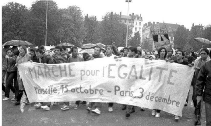
Sur la place Bellecour le 29 octobre 1983 pour la marche pour la paix, l'égalité et contre le racisme.