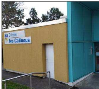
Crèche Les Calinous.

« On comprend le mécontentement des parents. Nous allons faire le maximum pour essayer d'ouvrir des places supplémentaires au fur et à mesure des semaines à venir, ajoute-t-elle. Une liste des familles qui n'ont pas pu être accueillies va être transmise à la mairie, pour les rediriger vers des places d'urgence dans d'autres crèches de la ville ».