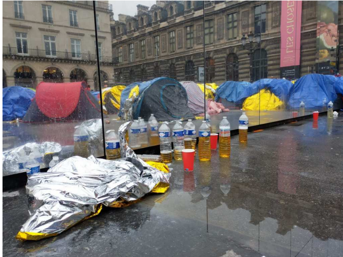
Des bouteilles en plastique servent de pissotières .

Pour Yann Manzi, l'idée est aussi d'alerter sur "la réalité du froid", alors que les températures dégringolent et que des centaines de personnes, notamment migrantes, sont chaque soir laissées à la rue.