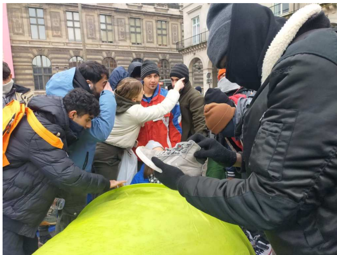
Une distribution de chaussures sur le campement devant le Conseil d'Etat, lundi 5 décembre.