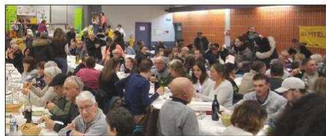
Une belle soirée au profit du Téléthon.

C'est le nombre de repas servis vendredi soir à l'occasion du 29 e Téléthon. Une manifestation remarquablement bien organisée par le comité, les nombreux bénévoles, les associations et les artisans-commerçants du village. Cette soirée conviviale a permis aux Marcellinois de passer un excellent moment, mais aussi de soutenir une belle cause au service de l'AFM (Association française contre les myopathies). La remontée des fonds aura lieu le lundi 12 décembre à 20 heures à la salle du Colombier.