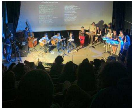
Les chanteurs accompagnés des musiciens ont interprété les classiques de Georges Brassens.

Plébiscité par les Saint-Germinoises lors de l'assemblée citoyenne, le projet de rendre hommage à Georges Brassens s'est concrétisé ce samedi 29 octobre avec un concert participatif.