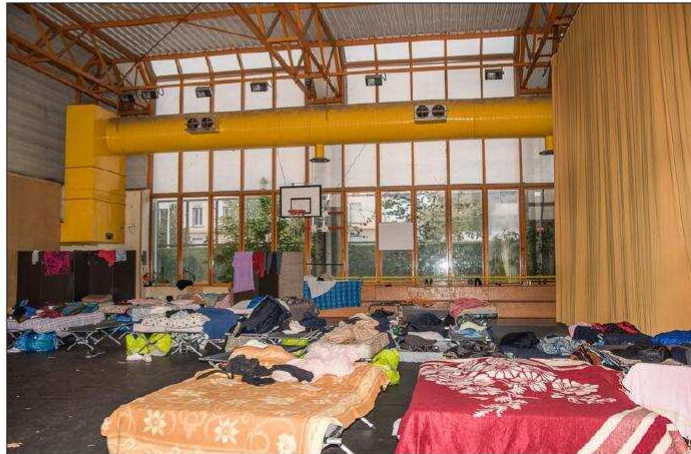
Des couchettes ont été installées dans le gymnase.

Ils avaient débarqué là après l'évacuation du squat Le Chemineur et l'incendie du squat Chez Gemma, dans les Pentes, alors que la Station 2 ouverte par la Métropole et la Préfecture ne pouvait pas les accueillir, arrivée à saturation, à peine inaugurée. Ici, dans une situation précaire, ils avaient connu la canicule extrême, puis les pluies diluviennes. C'est lorsque le froid de l'hiver a commencé à pointer son nez que la mairie a décidé de les mettre à l'abri en ouvrant le gymnase dans le quartier de Monplaisir.