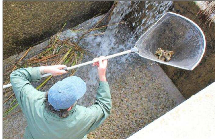
Avec obstination, Régis intervient sur chaque chute de canetons dans le déversoir.

La solution est simple : il suffirait de tendre un minifilet (du style de ceux utilisés pour les tables de ping-