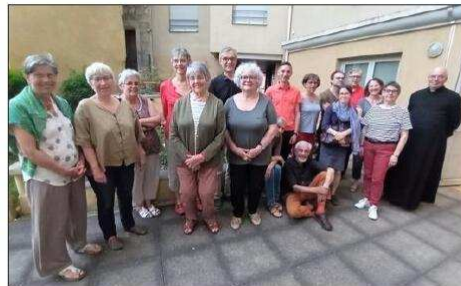
Un collectif d'Oullinois qui œuvre dans l'humanité.

Des citoyens accompagnés par la paroisse se mobilisent pour venir en aide à des familles ukrainiennes, une dizaine dans la commune.