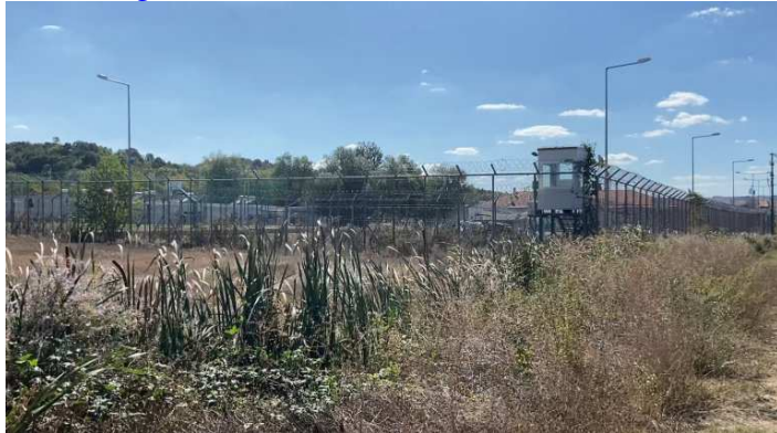
Le centre de Fylakio, en Grèce continentale.