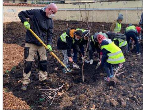
Les enfants ont procédé, lundi, à la plantation des arbres et arbustes.

Au total, 19 arbres vont être plantés, avant la pose par l'équipe de jardiniers de la Vil-