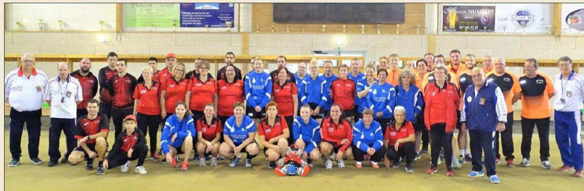
Les équipes masculines du pays de l'Arbresle et Annonay (orange) et féminines du pays de l'Arbresle et Saint-Vallier (bleu).

Jeudi 11 novembre, le boulodrome de Grands champs à Sain-Bel a vécu une belle journée de sport boules en présence d'un public très connaisseur. L'équipe masculine 2 du pays de l'Arbresle (championne de France national 4) a accueilli en championnat national 3 des clubs sportifs, l'équipe de Givors et s'est inclinée 20 à 25. L'après-midi, l'équipe masculine 1 du pays de l'Arbresle en championnat national 1 a reçu les Ardéchois d'Annonay et subit une défaite 20 à 27. En parallèle, l'équipe féminine du pays de l'Arbresle en championnat national élite 2 a disputé un match très sérieux contre le leader, Saint-Vallier et a tenu l'équipe en échec avec le partage des points à 22. Belles victoires pour Océane Derozard en simple et en combiné, Justine Sage en combiné, Sandrine Bedrine en tir de précision et dans le jeu traditionnel en double avec Valérie Raduha.