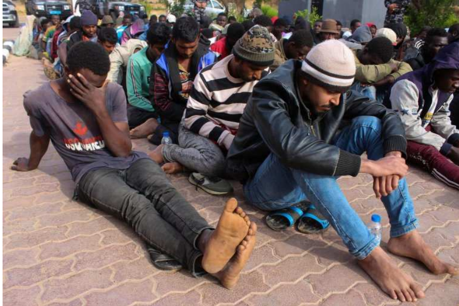
Des migrants à Khoms, en Libye, le 30 mai 2020 (image d'illustration).