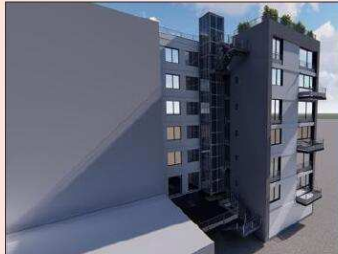
La maison intergénérationnelle est située rue Vaillant-Couturier.