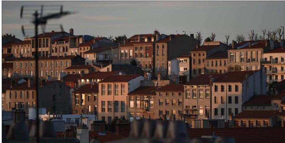
Les loyers proposés sont compris entre 5 et 6 euros le m 2 et ils sont couverts par les aides au logement.

« Le propriétaire qui consent un loyer solidaire peut bénéficier