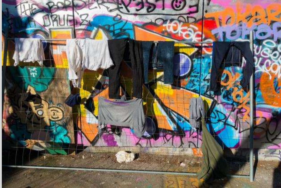
Le squat de la Croix-Rousse.

générales ont permis d'expliquer les gestes barrière , traduits en plusieurs langues. "Des gestes très bien respectés" , ajoute Nicole Smolski. Des distributeurs de savon ont également été installés.