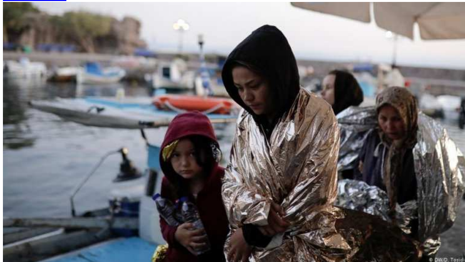
Des migrants à leur arrivée sur l'île grecque de Lesbos.

https://www.infomigrants.net/fr/post/22441/la-grece-veut-eriger-une-frontiere-flottante-sur-la-mer-pour-limiter-l-afflux-de-migrants