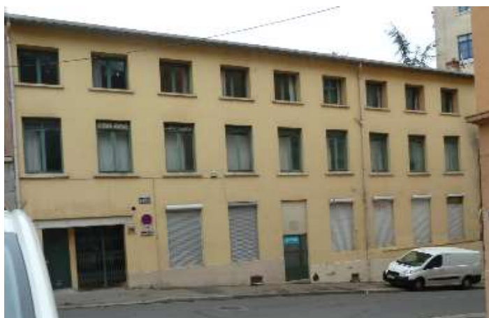
← Janvier 2014 : squat rue E. Pons, Lyon 4 e Puis expulsion le 30/07/14.