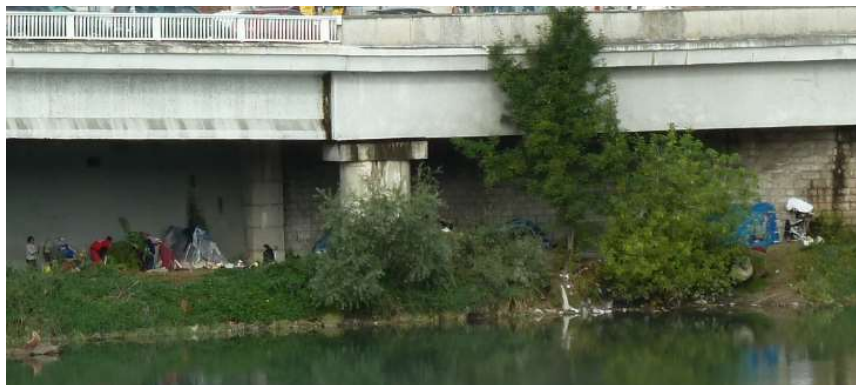
← Octobre 2013 : sous le pont Delattre de Tassigny, Lyon 1 er Puis expulsion ?...